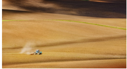
Tracteur dans un champ ukrainien

L'Ukraine est le grain à blé de l'occident. La Russie et la Chine sont des concurrents pour les États-Unis et surtout la finance qui veut diviser pour régner. Viktor Ianoukovytch est déstabilisé par la CIA en 2013 finançant les nazis et des manifestants alors armés.